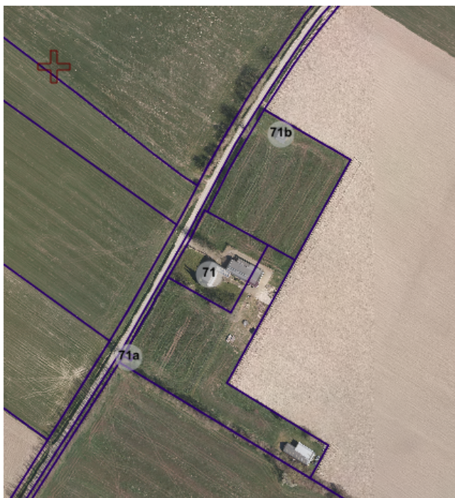
bovenaanzicht op Zeelandsestraat 71

Door de eigenaar van de gronden aan de Zeelandsestraat 71 te Millingen is het verzoek gedaan voor het plaatsen van zonnepanelen op de gronden die ten noorden en zuiden van de woning liggen. Het zonnepark krijgt een totale oppervlakte van ca. 4.000 m 2 (=0,4 ha).