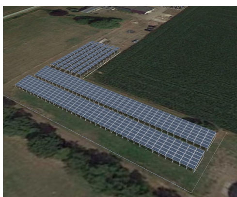
zonnepanelen op de gronden ten noorden en zuiden van de woning

De voorwaarden uit de gemeentelijke Ruimtelijke Visie op duurzame energie zijn van toepassing op de pilots voor zonnevelden die groter zijn dan 2 ha. U hebt onlangs een 4 e pilotproject benoemd en besloten voorlopig geen nieuwe pilots te benoemen.